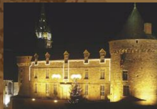
Château de Sillé-le-Guillaume