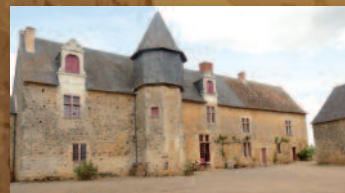
Le Logis à Fontenay-sur-Vègre