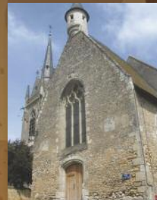
Église de Parcé-sur-Sarthe