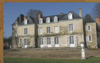
Le Château du Petit-Bois à Dureil

Horaires de visites (à régler sur place) :