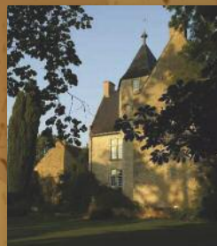
Le Mirail à Crannes-en-Champagne