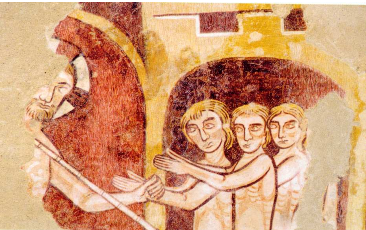
Église Saint-Hilaire, peintures murales 12e-13e s., Asnières-sur-Vègre

Plus tard, au cours du 19 e siècle, la physionomie du village évolue avec le déplacement du centre vers l'est, autour du lavoir communal puis de la mairie-école. De nouvelles règles d'urbanisme président alors à la construction de maisons alignées sur la rue.